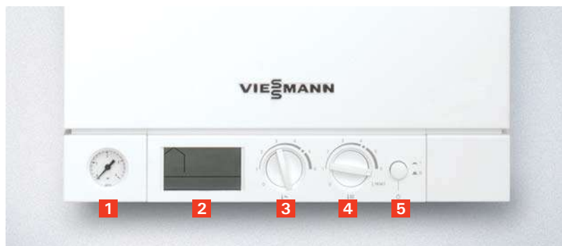
Sistemul de automatizare digital cu sistem de diagnoză

Deservirea instalației se realizează simplu și comod prin intermediul butoanelor rotative de reglaj a temperaturilor de încălzire și de preparare a apei calde menajere. Pe afișajul digital sunt indicate temperaturile și parametrii de stare ai instalației termice.