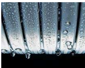
Suprafețe de transfer termic Inox-Radial

Cazanul mural Vitodens 100-W cu arzător, grup hidraulic și schimbător de căldură din oțel inoxidabil, oferă tehnologia de condensatie într-un spațiu redus și la un preț atractiv.